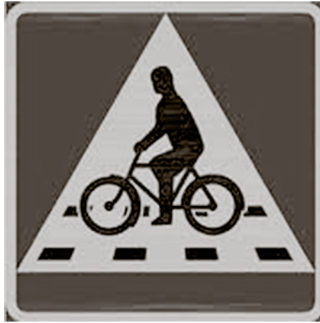
Nya märket för "Cykelöverfart".

De nya cykelöverfarterna utmärks med ett nytt vägmärke, förvillande likt det som redan gäller vid övergångsställen. Dessutom blir det alltså en ny linjemarkering i vägbanan för gupp, grop eller liknande hinder.