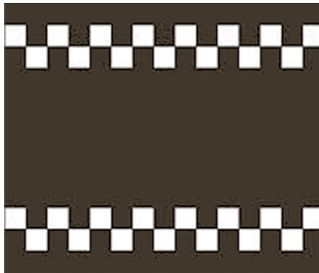
Varningslinje för fartdämpning.

Det kommer att bli spännande att se, vad som händer med alla motorfordon, som missar denna information och i bästa fall hinner panikbromsa i sista stund. Det gäller ju att kunna uppfatta cyklisters INTENSION att korsa gatan – och då får man verkligen vara snabb.